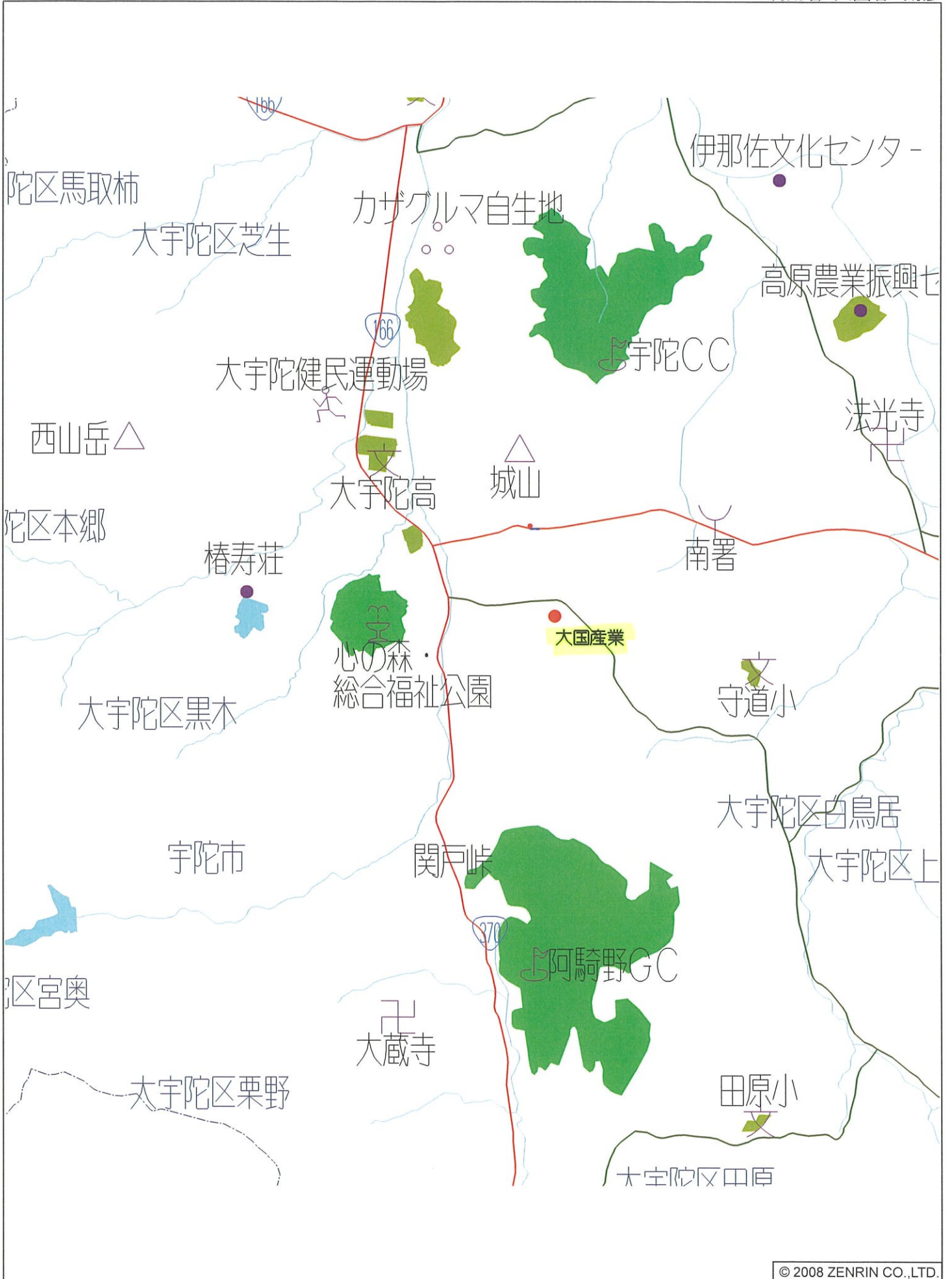
宇陀市大宇陀区 大東付近