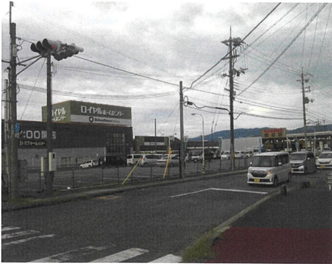
ロイヤルホームセンター奈良店