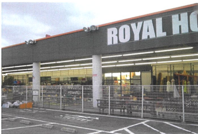
ロイヤルホームセンター奈良店