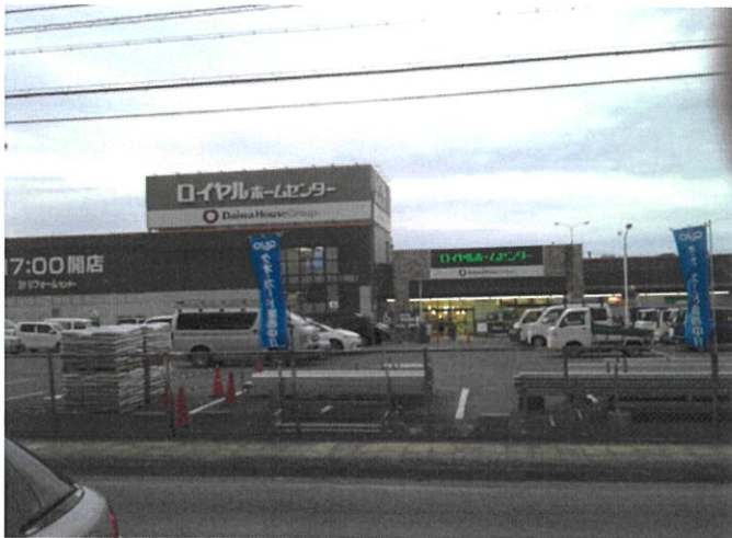
ロイヤルホームセンター奈良店