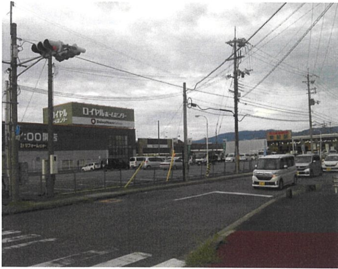
ロイヤルホームセンター奈良店 国道24号線付近より