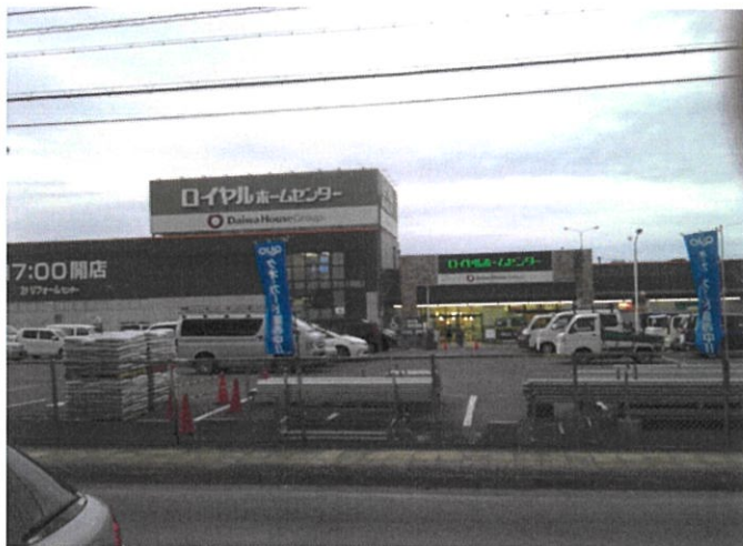
ロイヤルホームセンター奈良店 建物外観