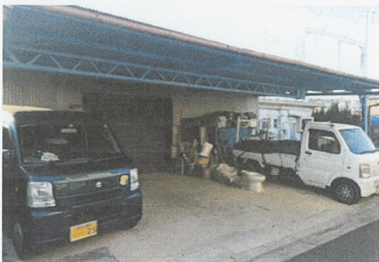
① 倉庫 外観