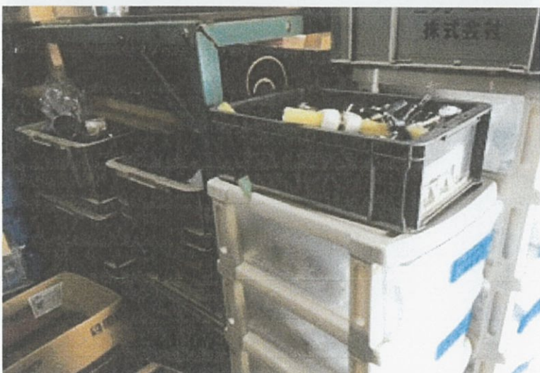
③ 倉庫 内部