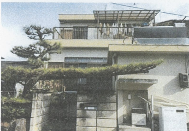
② 事務所 外観