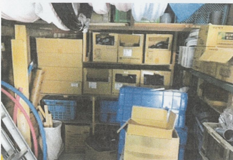
② 倉庫 内部