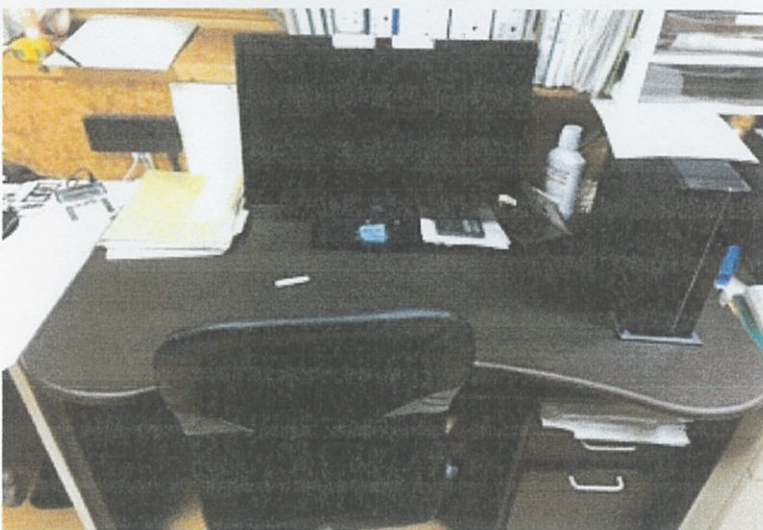
③ 事務所 内部