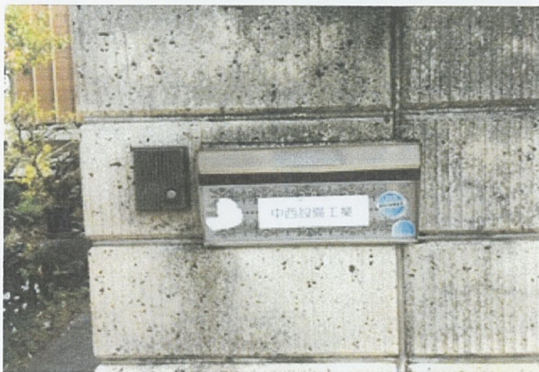
① 事務所 外観