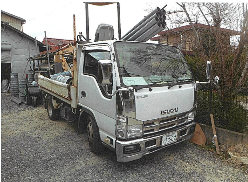
ダンプトラック 3 t