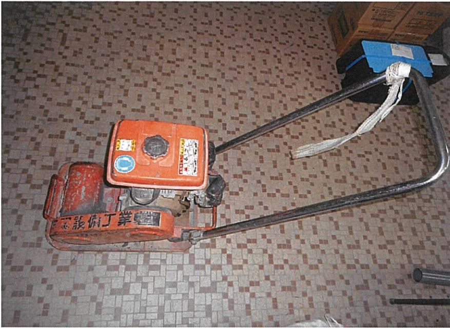
プレートコンパクター