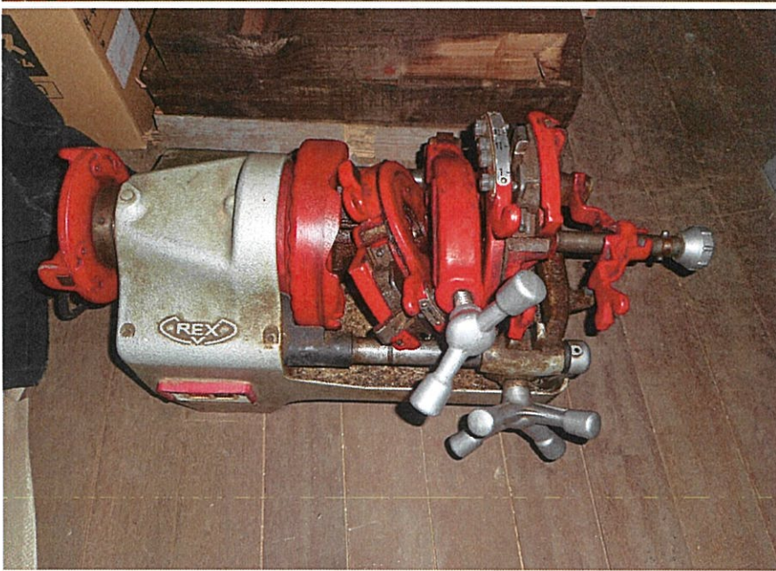
・ 管の加工 電動ねじ切機