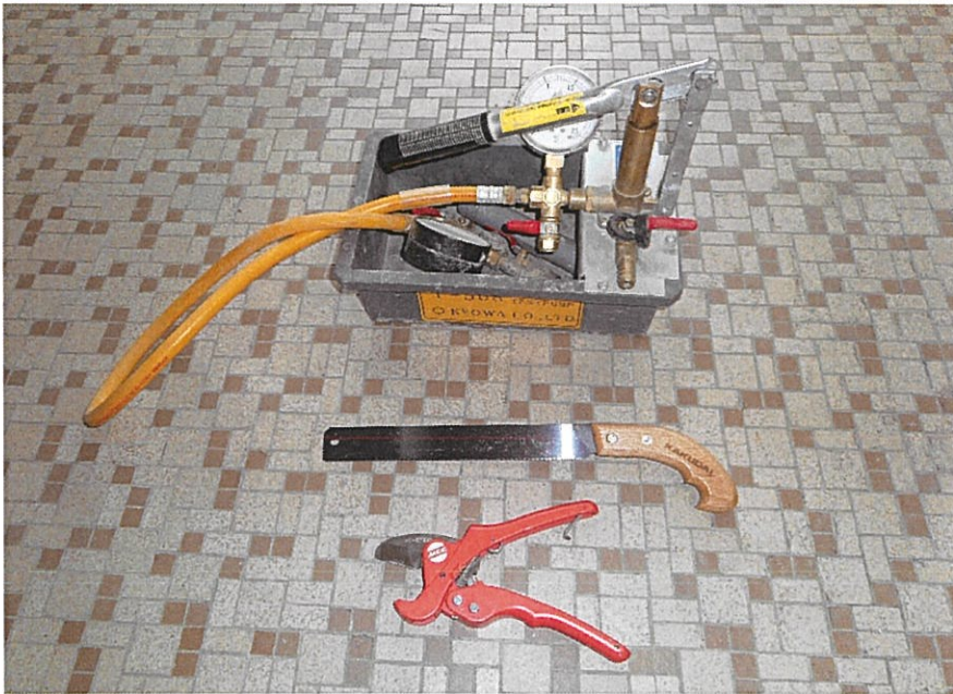
水圧テストポンプ