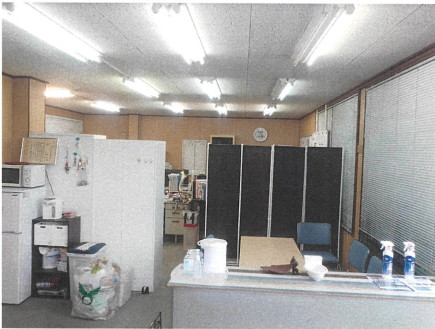
事 務 所 内