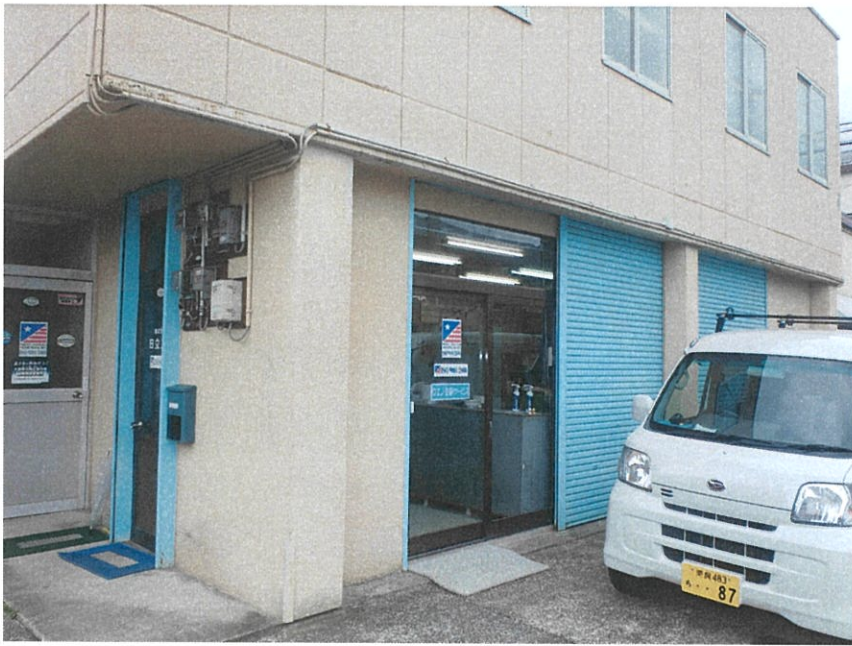
事 務 所 外 観