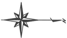
平面図 1 : 100