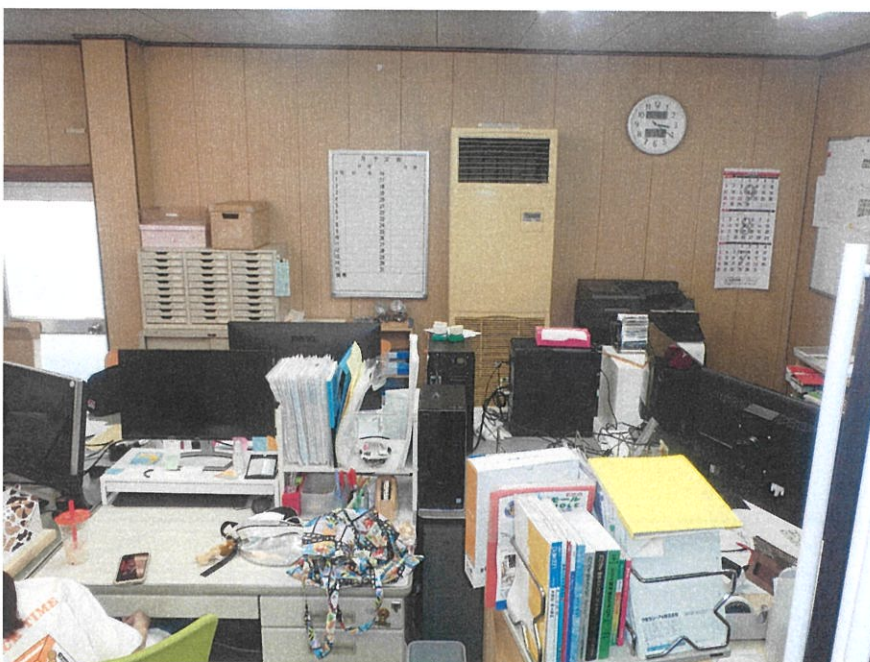
事 務 所 内