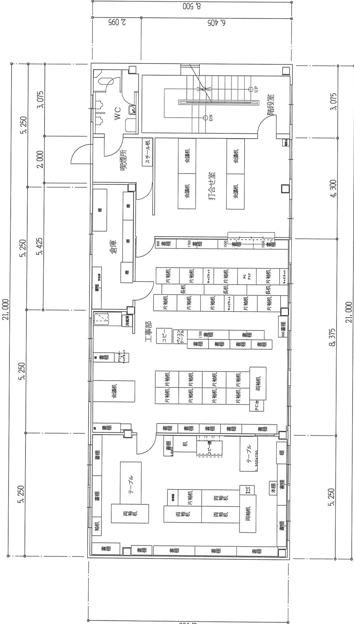
2階平面図 S = 1 : 100