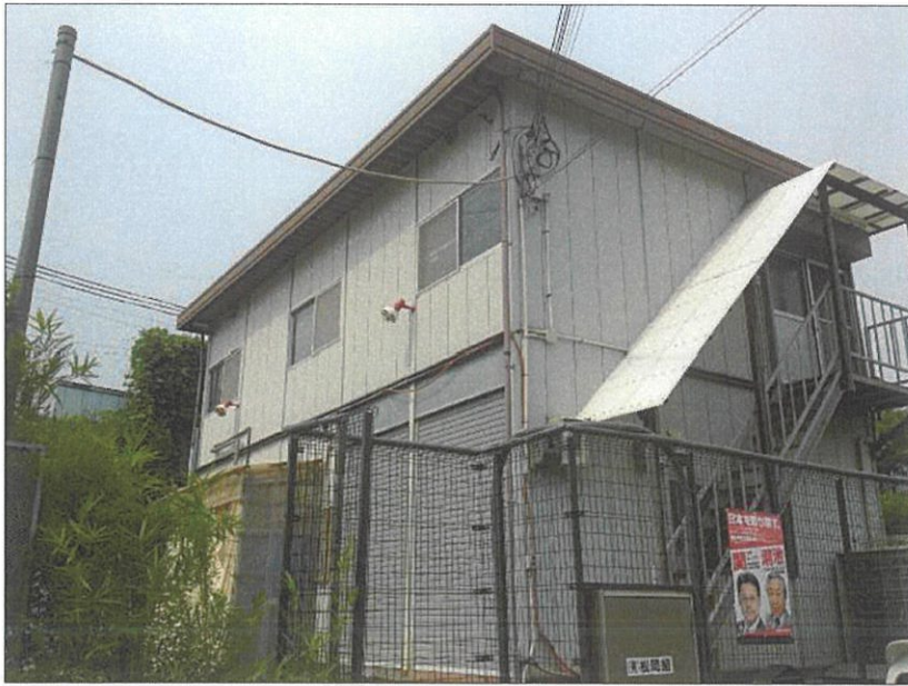
事務所 事務所内外写真 神戸市西区榎谷町寺谷1242-693