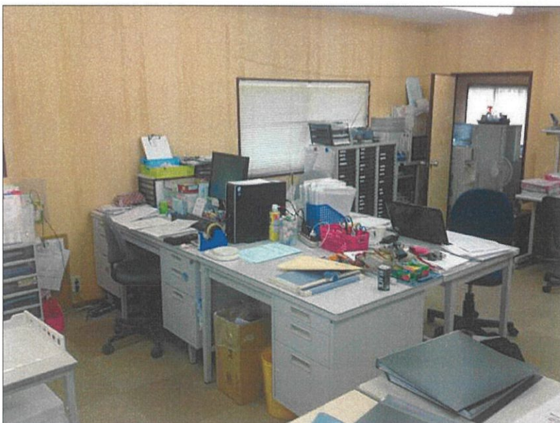
事務所 事務所内外写真 神戸市西区榎谷町寺谷1242-693