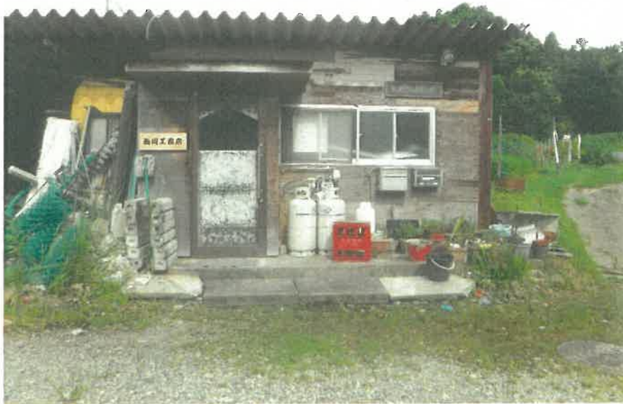
西岡工務店事務所内